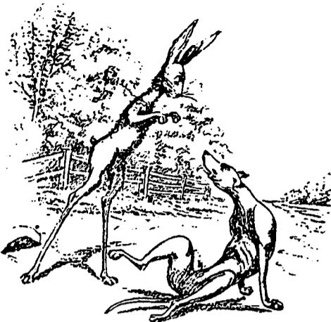
M. DU LAPIN.—Touchez-moi, si vous l'osez !