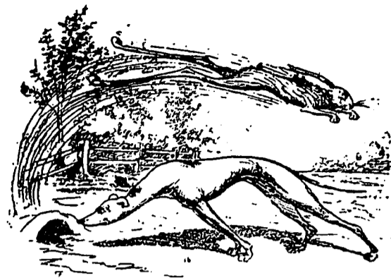
M. DU LEVRIER.—Ah bien, s'il n'est pas entré dans ce trou d'une manière miraculeuse, je veux être fouetté !