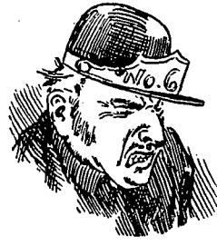
IV Ho! Le frein!