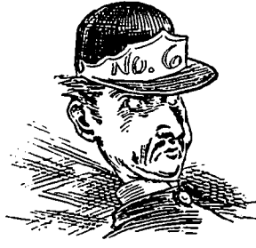
III L'approche d'un détour.