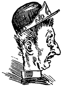
V Une personne sur la voie!