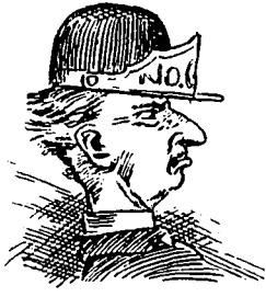
II Le départ.