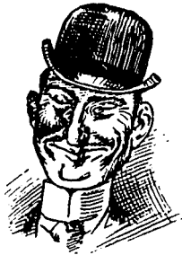
I Obtenu l'emploi.