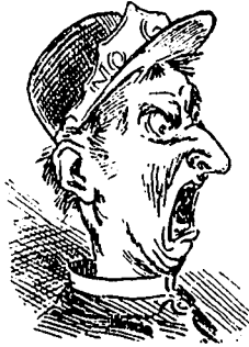
VII Un fourgon sur la voie!