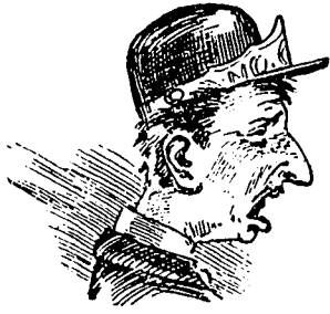
VI Une rache sur la voie!