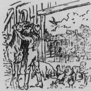
L'AMI DES PAUVRES.