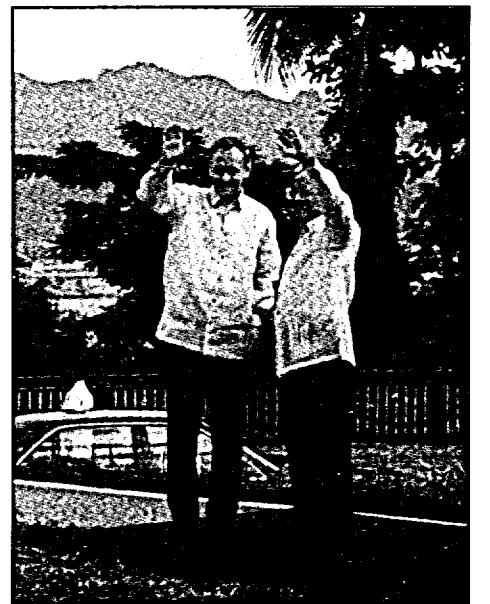
Le président des Philippines, Fidel Ramos, fait ses adieux au premier ministre Chrétien après la réunion des dirigeants de l'APEC en novembre 1996, à laquelle il a présidé. Le Canada assumera la présidence de l'APEC en 1997 et la réunion annuelle aura lieu à Vancouver.

De 1994 à 1995, les exportations canadiennes vers le Japon ont augmenté de 24 %, tandis que les ventes à Singapour, à la Malaisie, à la Thaïlande et à l'Indonésie se sont accrues de 47 %.