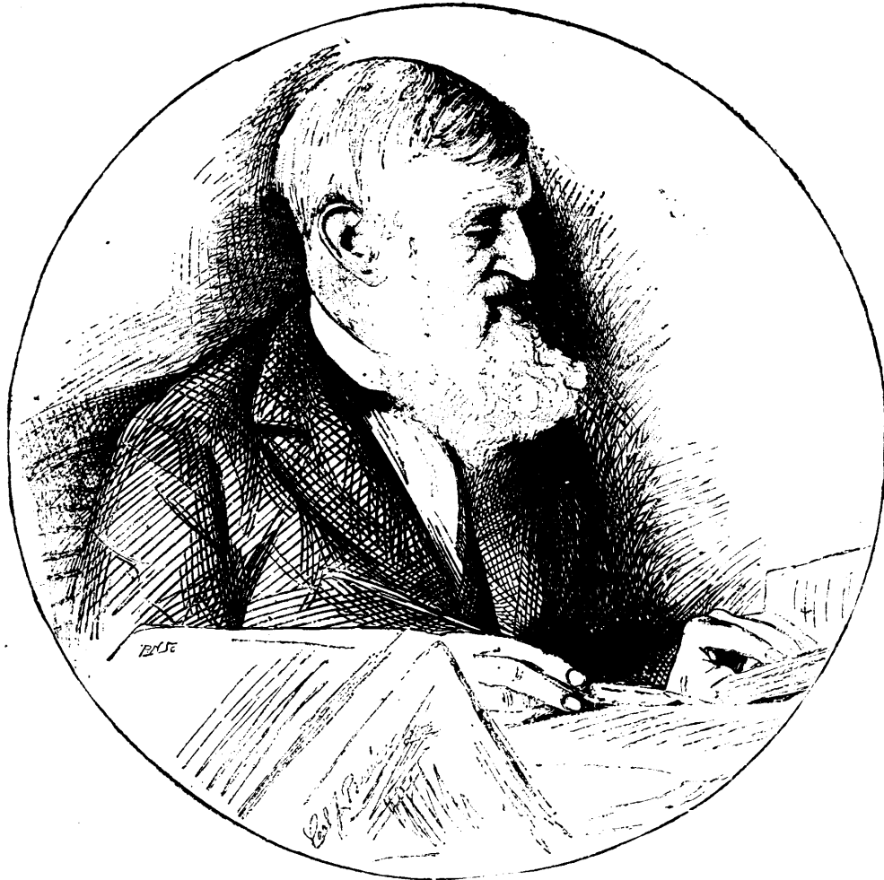
L'HISTORIEN GEORGE BANCROFT, DÉCÉDÉ

La ligne, par insertion - - - - 10 cents Insertions subséquentes - - - - 6 cents Tarif spécial pour annonces à long terme