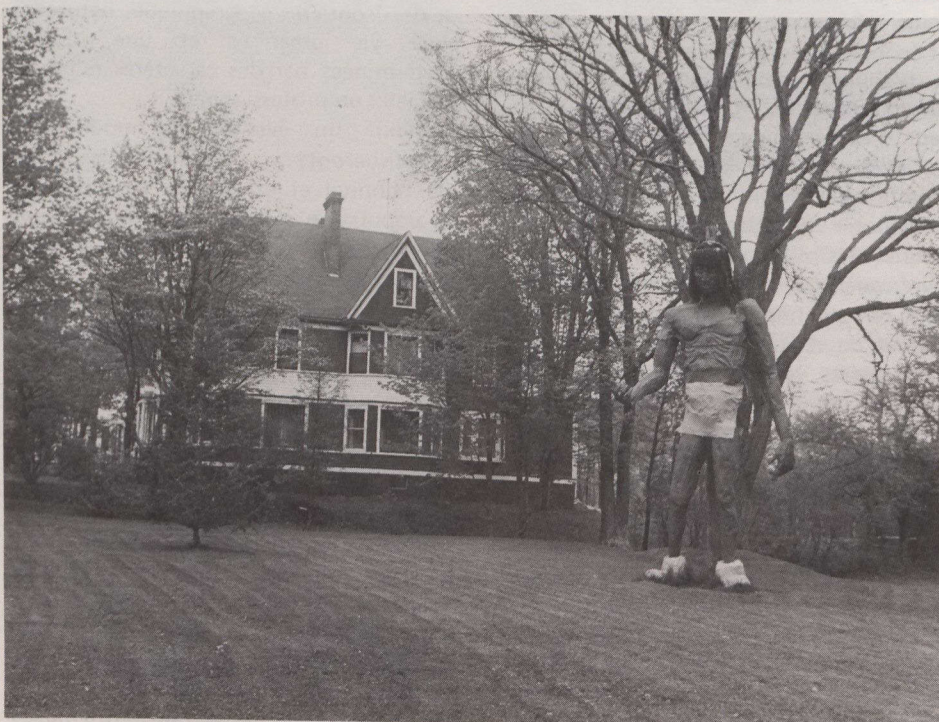
Le héros indien de la légende de Glooscap, à Parrsboro en Nouvelle-Écosse.

Le Festival des palourdes se tient durant deux jours sur la plage d'Economy et est l'occasion d'activités variées : défilés, marché d'artisanat, concours d'écaillage de palourdes, mollusques qui