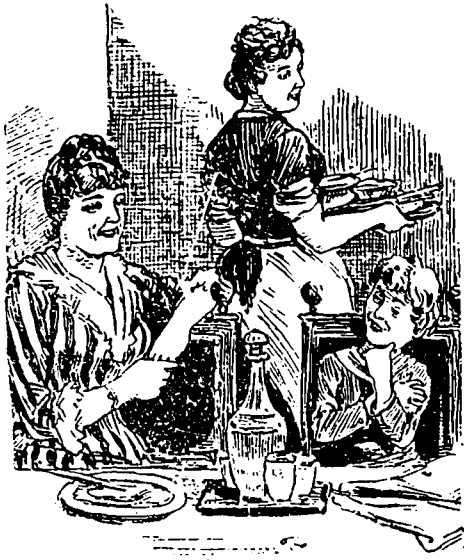
(Une réplique de carême)

La maman, expliquant l'histoire sainte.—Qu'est-ce que tu penses que Loth a dit quand il a vu sa pauvre femme en sel ?