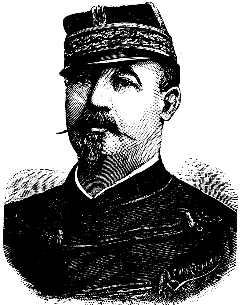
LE GÉNÉRAL SAUSSIER, GÉNÉRALISSIME DE L'ARMÉE FRANÇAISE