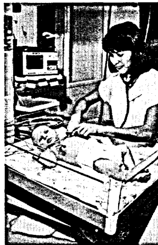
Incubateur pour nourrissons

Nourrissons. Le nouveau type d'incubateur mis sur le marché n'enferme plus complètement le nourrisson; il est composé d'un contenant en plastique ouvert au-dessus duquel, à quelques pieds, est installé un dispositif de chauffage informatisé qui garde l'air à une température constante.