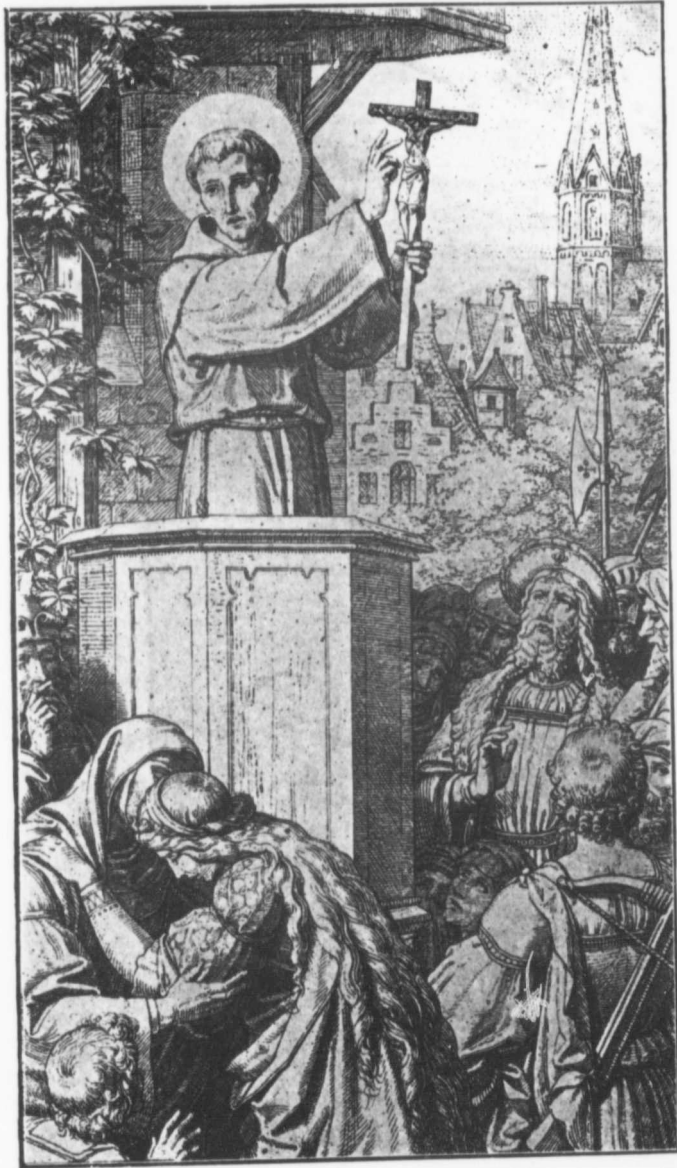
SAINT JACQUES DE LA MARCHE