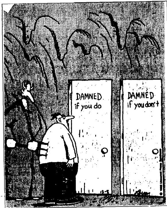
«Allez, allez. C'est l'une ou l'autre.»

...et à prendre les décisions qui s'imposent.