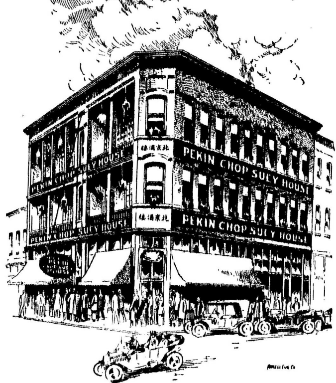
本樓在雲南路打街夾卡路街角喊線失磨四六七皇家信 箱五九四

JOHNSTONS BIG SHOE HOUSE Ltd 409 Hastings Street West Vancouver, B. C.