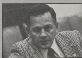
NEIL YOUNG BEACHES

«Le Comité ne croit pas qu'il exige plus que ce qui existe déjà pour d'autres groupes de Canadiens; les hommes d'affaires, les savants, les fermiers, les syndicats et les femmes, pour ne citer que quelques groupes. Il ne s'agit pas de savoir si les handicapés sont des membres à part entière de notre société. Ils le sont. Le problème, c'est simplement que l'organisation actuelle du gouvernement du Canada ne tient pas compte de cette réalité et qu'il faut combler cette faille le plus tôt possible.»