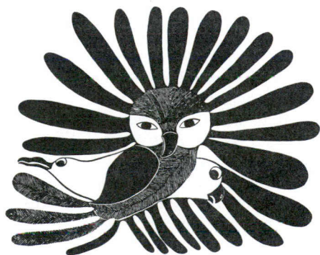
Trio (Gravure sur pierre de Kenojuak)

Depuis des millénaires, l'Esquimau sculpte la pierre ou l'os. Sculpter pour satisfaire au besoin spirituel d'un hommage à ses propres divinités, ou pour son propre plaisir, est, pour l'Esquimau, le simple prolongement de l'accomplissement des rites de la vie quotidienne. Jusqu'à récemment en effet, pour fabriquer les armes de chasse et les outils qui lui permettaient de survivre, le chasseur esquimau devait apprendre à frotter, faire éclater, gratter et creuser ses matériaux, l'os et la pierre. L'objet utilitaire fabriqué, l'Esquimau l'ornait de dessins représentant les esprits qui, selon sa religion animiste, peuplent l'univers. Il sculptait également des amulettes pour le protéger des mauvais esprits, et des miniatures représentant l'animal que le chasseur souhaitait tuer.