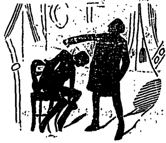
A, moins qu'il ne se marie, Anatole y consent et son oncle le bénit.