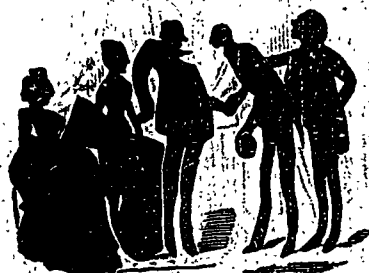
Deux jours après il le présente dans une famille excessivement distinguée.