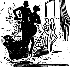
Anatole, subjugué par la taille de la demoiselle de la maison, profite de la jérépolka pour faire une dernière déclaration.