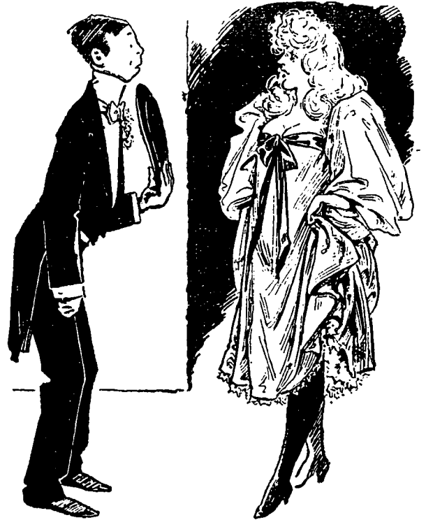
Le jeune Idiotin. — Enchanté de vous rencontrer, mademoiselle Irma ; vous allez venir souper avec moi. J'ai beaucoup d'argent, vous savez !