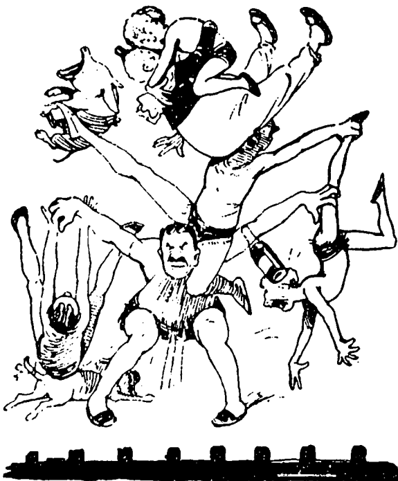
...uer... Mais l'effet a été plutôt mauvais.