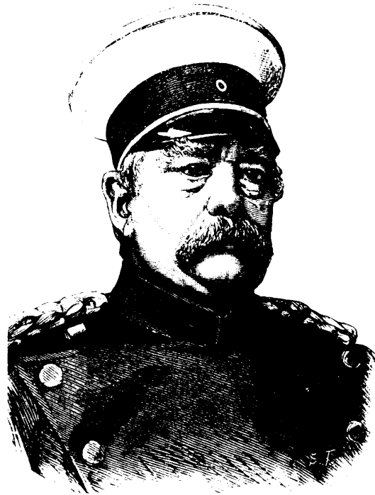
LE PRINCE DE BISMARCK, Premier plenipotentiaire allemand.