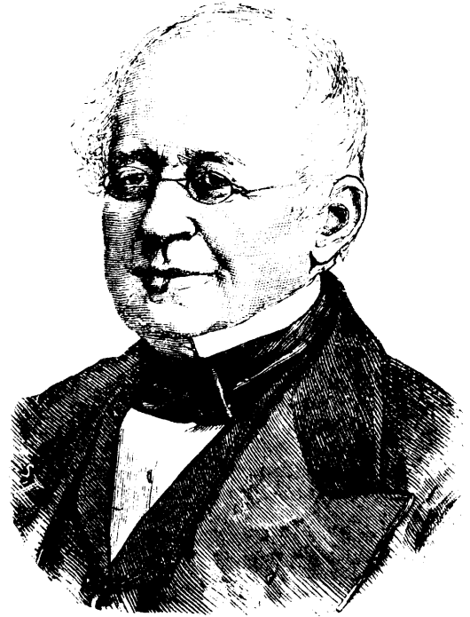
LE PRINCE GORTSCHAKOFF, Premier plenipotentiaire russe.