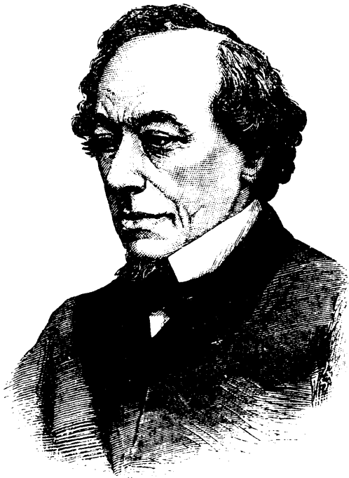
LORD BEACONSFIELD, Premier plenipotentiaire anglais.