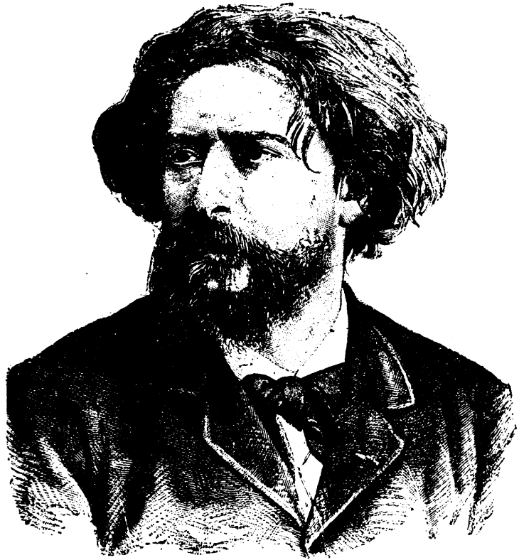
M. ALPHONSE DAUDET, LITTÉRATEUR