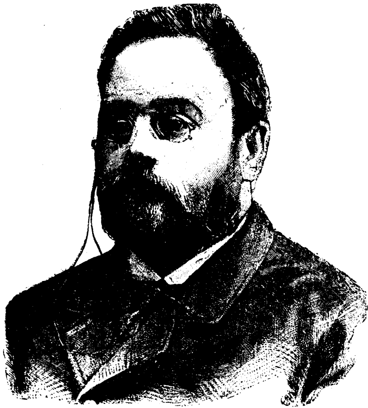
M. ÉMILE ZOLA, LITTÉRATEUR

ABONNEMENTS : Six mois : $1.50. — Un an : $3.00