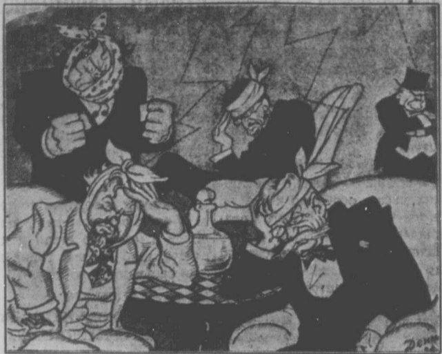
Лютнева революція в Росії, відчиняє двері до Жовтневої революції, порозбиває голови панам.

Царат! Яке страшне, зненавиджене слово! Царське самодержавство — означало для революціонерів, для тих, що словом чи ділом боролися за волю: Петропавловську твердиню, шлісельбургську, якутську, вірчинську, каторжні тюрем, сотки інших страшних темниць, в яких до смерті замучували найкращих борців за волю народу, де божевільні люди науки, вільної думки; царат — це заслання на Сибір соток тисяч, це нагайка подіная, козака, це ганебне гвалтування жінок, це кроваві погроми, провокація, шпіонажа, шибениці. Царська Росія — це тюрма народів.