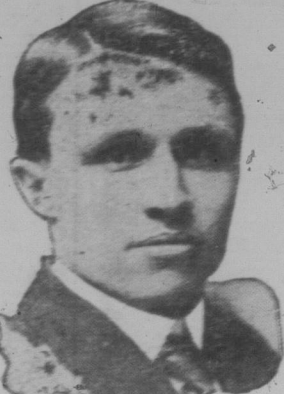
Premier G. Gardiner