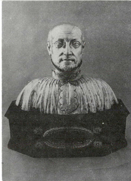
Reliquaire du Père Jean de Brébeuf. — Paris 1664-1665 — Anonyme. (Monastère des Augustines de l'Hôtel-Dieu de Québec.)

La majeure partie des pièces d'orfèvrerie que le public peut admirer à l'occasion de cette exposition avait une fonction liturgique. Plusieurs d'en-