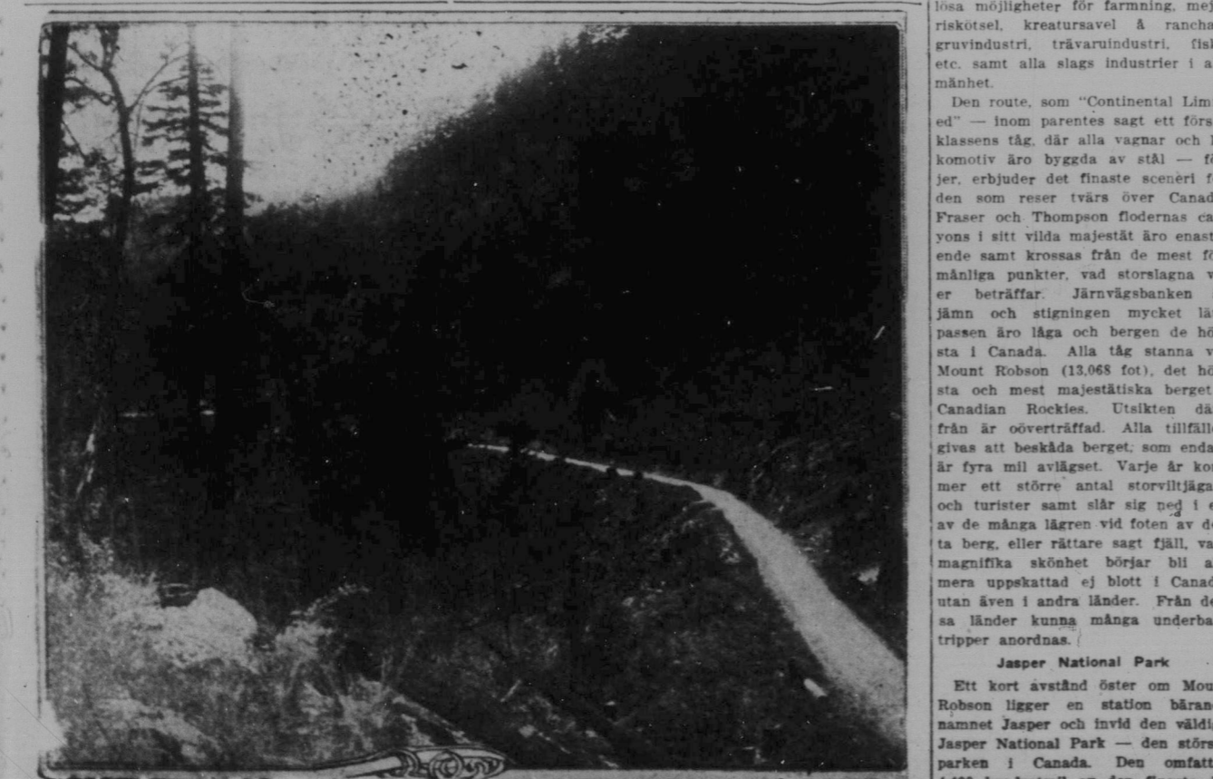
En från Malahat Rivr, Vancouver Island och dess bergsländskap.