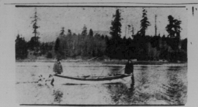
En typisk British Columbia sjöscen.

Det är endast min mening att i denna artikel giva några strödda drag från den i så många avseenden märkliga provinsen British Columbia, som alltid har intagit och alltid kommer att intaga en särställning bland Canadas provinser på grund av dess egenartade naturliga drag. British Columbia, eller B. C., som