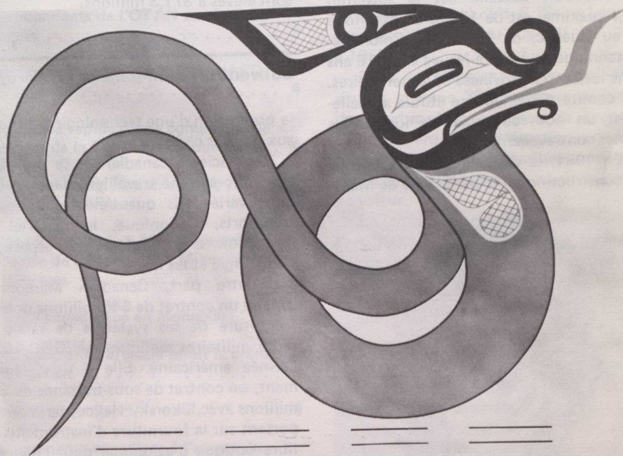
Serpent de mer, Ron Hamilton, 1972.

Enfin, le Directeur général de la Bibliothèque nationale créera un petit comité consultatif qui l'aviserait des priorités. Ce comité collaborera également avec les organismes compétents à la mise sur pied de ces services.