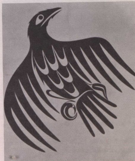
Ka-in (corbeau), Joe David, 1978.

Depuis des milliers d'années, le dessin décoratif occupe une place importante dans la culture des populations de la côte ouest qui l'ont utilisé pour orner des sculptures, des façades, des pièces de vannerie et des écrans de cèdre. Aujourd'hui, les artistes utilisent des procédés modernes, tels que la sérigraphie, pour reproduire les légendes et les arts anciens faisant partie de leurs traditions.