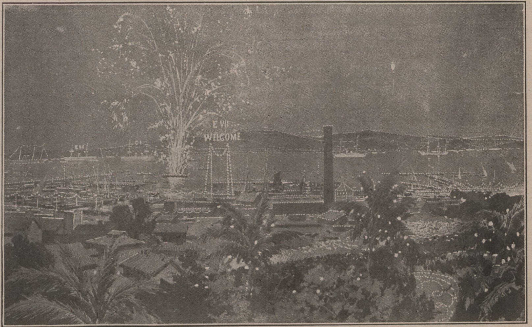
LISBONNE.—Grandes illuminations sur le Tage, lors de la visite du roi Edouard VII dans la capitale du Portugal

Il est certain que les premières victimes de la campagne contre les Albanais seront les Serbes du vilayet d'Uskub, qui sont désarmés et qui vivent dans la terreur continuelle de leurs féroces ennemis. Dans beaucoup de villages serbes du territoire ture, les Serbes portent le même costume que les Albanais et parlent la même langue, pour ne pas irriter leurs ennemis.