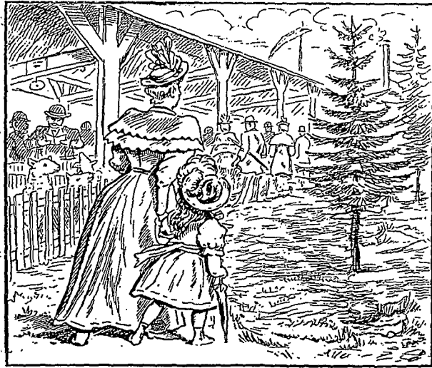
Une exposition de bestiaux ; trouver le gros mouton.