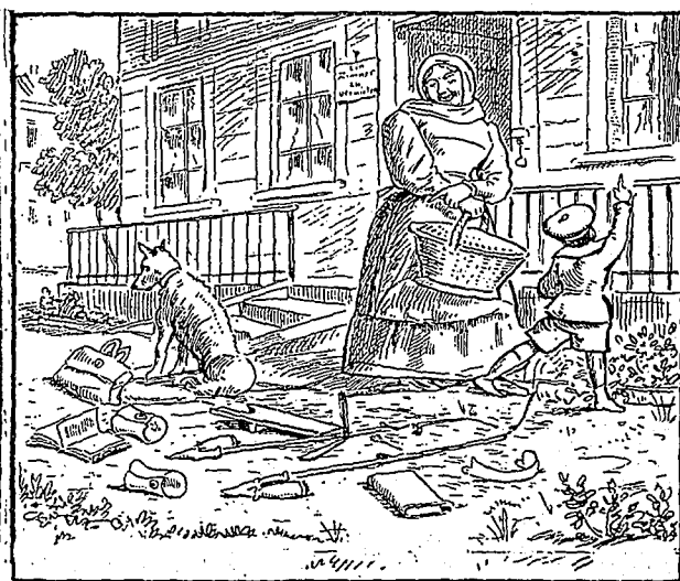
Une maison de pension ; trouver le pensionnaire qui a été jeté dehors avec ses effets.