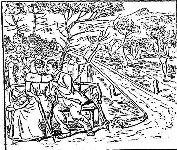
Les amoureux se croient seuls ; trouver le photographe.