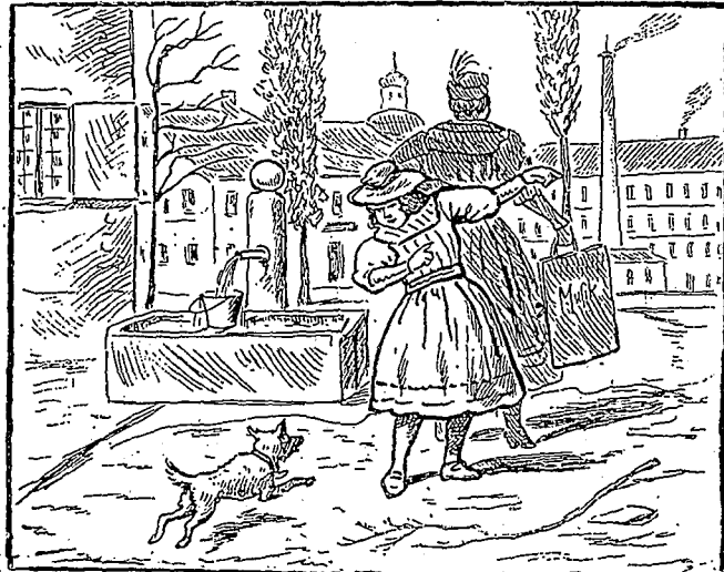
Une cheminée qui fume ; trouver le ramoneur.