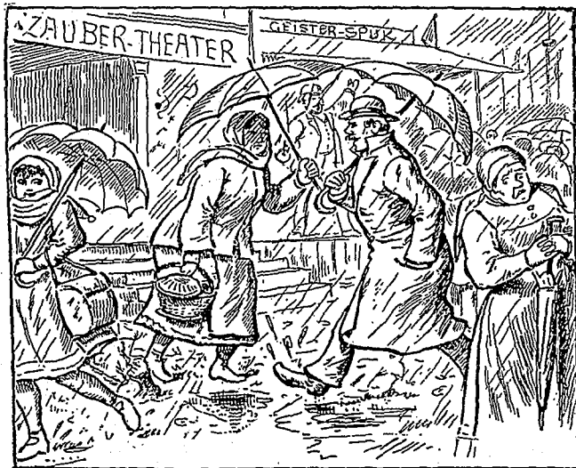
Il fait mauvais temps ; trouver l'enfant qui pleure.