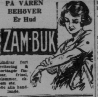
PÅ VAREN BEHÖVER ER HUD ZABRIN

Ären som lokomotivdrivare. Han hade alltid ett "lilla Amerika" där hemma i Sverige. Men ungdomsår och äventyrslystnad drogo honom till många andra landsdelar ut i världen.