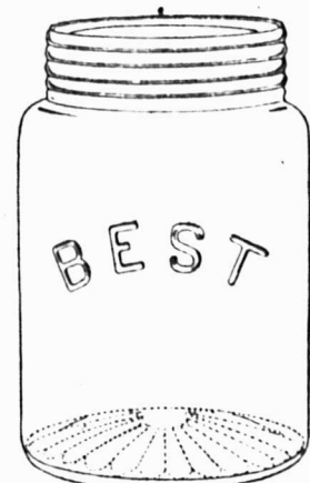
Faits au Canada