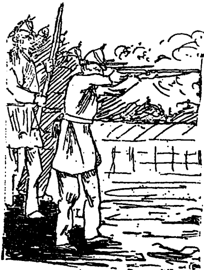
LA BATAILLE DE SEBASTOPOL

Je me rappelle de ce temps comme si c'était hier. Le petit vendeur d'extra a crié pendant six mois la prise de Sébastopol. L'extra ne se serait pas