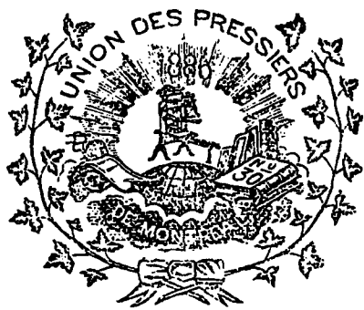
LA PRESSE A BRAS

L'impression se faisait sur une presse à bras dite de Washington. L'imprimé