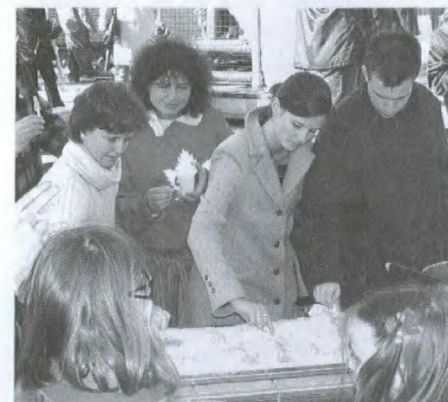
Dégustation de sirop d'érable au kiosque du Canada

kiosque. Ce sont les multiples rencontres et préparatifs faits à Ottawa, à Montréal, à Toronto et, plus récemment, à Vancouver par le Ministère et les ambassades des pays baltes au Canada qui ont permis une participation aussi active.