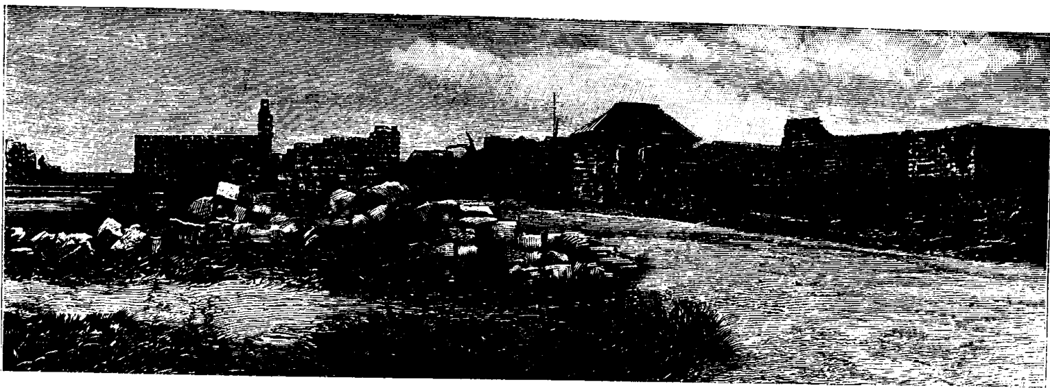
TONDO.—Ruines du faubourg