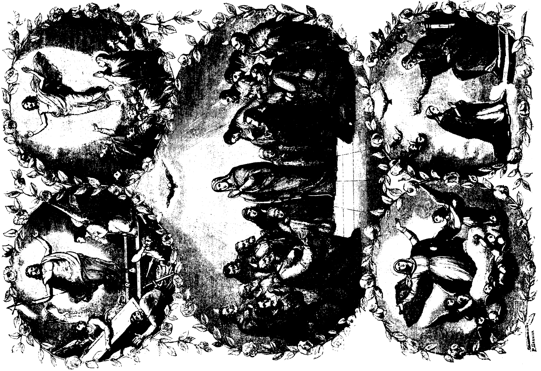
Le Règne glorieux de Jésus-Christ préparé par la Résurrection et l'Ascension du Sauveur réalisé sur la terre au jour de la Pentecôte, consummé au ciel par l'Assomption et le Couronnement de Marie.