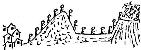
Le village Le Tengger La mer de sable Le mont Bromo

La cérémonie est prévue de façon à correspondre au moment où la pleine lune est à son zénith, directement au-dessus du cratère en ébullition. À mesure que la lune se lève, les villageois gravissent l'étroite cheminée du volcan. Une fois en haut, s'accompagnant de chants et récitant des textes sacrés, ou mantras, ils jettent au dieu leurs offrandes — argent, vivres, ou pétales de fleurs. (Espérons que c'est tout ce qu'il reçoit, car beaucoup d'hommes et de jeunes garçons se hasardent ensuite le long de la paroi intérieure du cratère pour récupérer les offrandes les plus précieuses.)