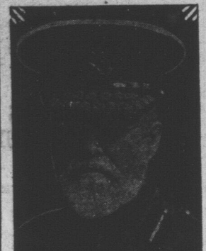
Sir John Morrison GIBSON, K.C.M.G., ancien lieutenant-gouverneur d'Ontario, qui vient de mourir subitement à sa résidence de Hamilton, à l'âge de 88 ans. Il fut un homme éminent et travailla constamment à promouvoir les intérêts canadiens dans le monde.