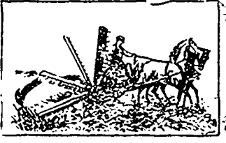
La Moissonneuse de Toronto dans le grain entrecroisé.

Prend les mesures pour obtenir de bonnes récoltes et est le moissonneur à profit. Celui qui se livre à la culture des grains sur une grande échelle EST OBLIGE d'avoir à lui une mesure automatique. La concurrence rend cette mesure d'une nécessité urgente. Pour les plantations de moindre étendue et les terrains moins préparés, on institue à un seul ou deux chevaux suffit. Le temps de la moisson est trop court pour ne se servir que de la faux et du tamis. Un BON CHEVAL, cette moissonnerie qui est un BON HOMME, et ce n'est pas un profit de faire repasser le cheval pendant que l'homme coupe le grain à la main.