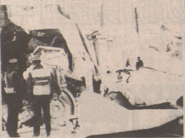
山泥掩埋四村 竟無人死亡 巴布亞新幾內亞的拉瓦尼亞山泥流掩埋了四條村落，但他們都幸免於難。據當地官員表示，由於山泥流發生在深夜，村民們都睡熟了，因此沒有人受傷。山泥流發生在拉瓦尼亞山，該山位於巴布亞新幾內亞的東部。山泥流發生後，當地政府立即展開了救援行動，但由於山泥流的規模太大，救援工作進展緩慢。目前，山泥流的清理工作仍在進行中。

對伊拉克軍不戰而降感愕然 美國兵對停火雀躍 仍懼薩達姆有陰謀 有回國前，不戰而降，已結束了。這僅僅是停火，不是戰爭結束。美國兵對停火雀躍，但他們對薩達姆的陰謀感到恐懼。美國兵在伊拉克戰場上，對停火感到雀躍，但他們對薩達姆的陰謀感到恐懼。他們認為，薩達姆可能會利用停火機會，重新組織軍隊，發動新的進攻。因此，他們對停火感到不安。