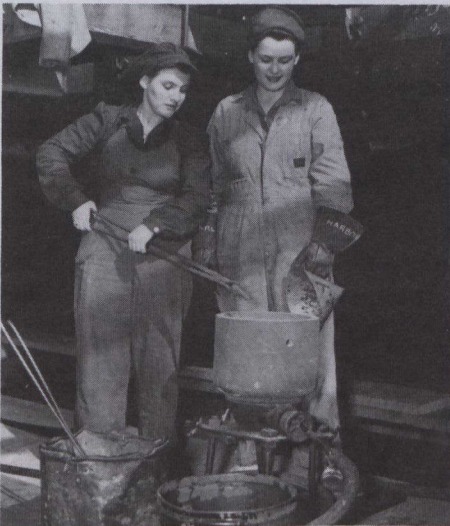
Remachadoras trabajando en una frageta en el Astillero Yarrow's Limited de Esquimalt, Colombia Británica.

La exposición se divide en cinco segmen-