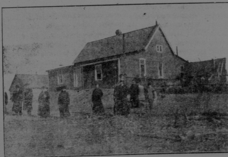
St. Peter's Kloster zu Münster in 1904.

Premier Minister, traf in Begleitung den Vertretern der Stadt in einem Automobil durch die Hauptstraßen und Parks gefahren wurde. Am Abend hielt der Premier eine Ansprache im großen Show-Gebäude. Am 13. Juli eröffnete Sir Wilfrid Laurier die Ausstellung und am 14. Juli Nachmittag