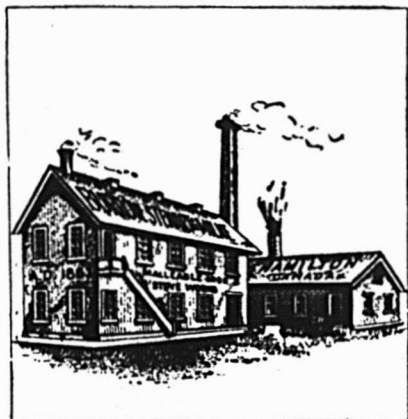
En l'année 1864