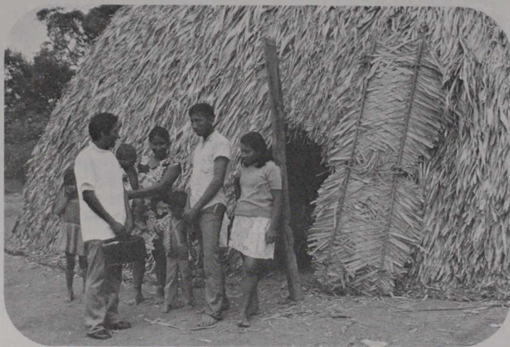
El personal paramédico en Venezuela viaja en bote y canoa para llevar atención médica a los pobladores remotos del Río Orinoco.

bían 31 escuelas de medicina y varios cientos de escuelas secundarias que enseñaban varios niveles de medicina. En los años sesenta se puso un nuevo énfasis en la salud rural. Los doctores en medicina de las clínicas rurales comenzaron a enseñar los rudimentos de atención al paciente a campesinos jóvenes. Estos "doctores descalzos" asisten a clases de tres a seis meses y después de haber practicado por algún tiempo reciben entrenamiento adicional.