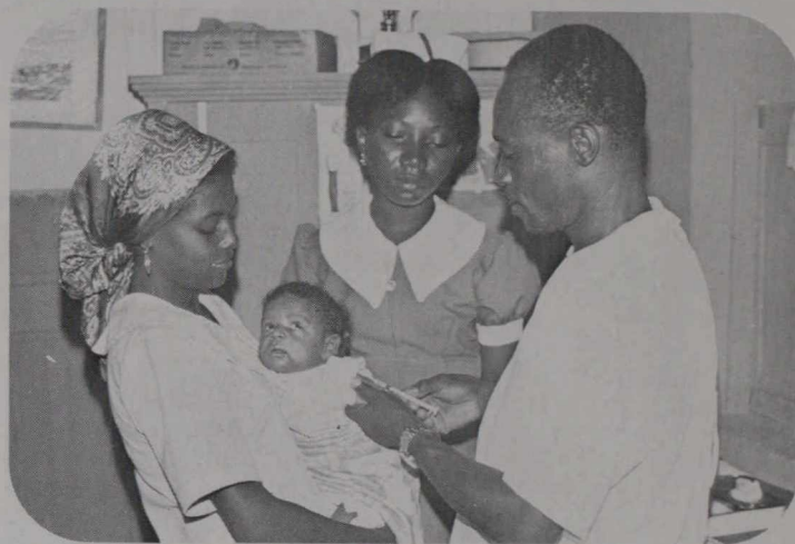
La vacunación en una etapa temprana forma parte del programa básico de salud en el Haití rural.

convirtió en médico en jefe de la Octava Armada en Ruta de Mao-Tse-Tung. Haciendo frente a tareas imposibles, fundó cerca de veinte hospitales de enseñanza, entrenando a cientos de doctores y enfermeras.