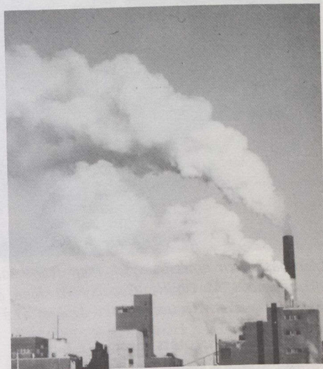
pour constater les dommages causés par les pluies acides.

M. Caccia a dit espérer que la conférence d'Ottawa, d'une part, permettrait aux pays de la Commission économique européenne (CEE) les plus sensibilisés aux questions touchant l'environnement de reconfirmer la promesse qu'ils ont faite de réduire les pluies acides et, d'autre part, inciterait les autres membres de la CEE à s'engager formellement à réduire les émissions. En vue de cette conférence, le ministre s'est rendu en Allemagne, en France et en Suisse, du 6 au 10 février,