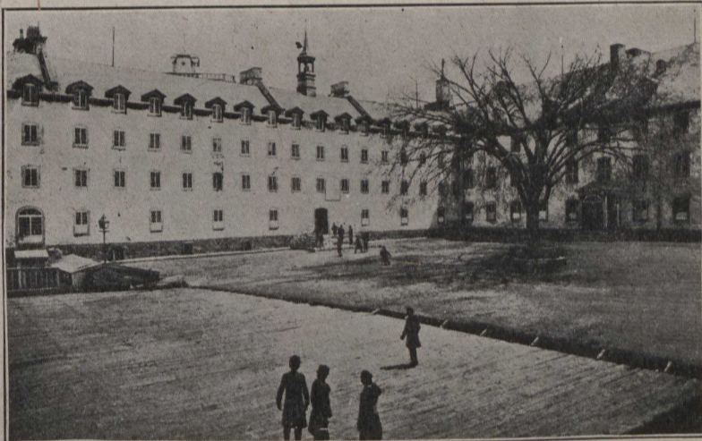
PETIT SÉMINAIRE DE QUÉBEC