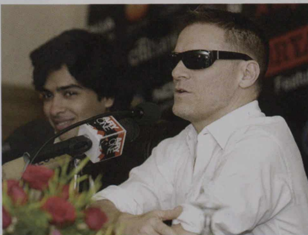
Le chanteur populaire pakistanais Shehzad Roy (à gauche) a invité Bryan Adams à participer à une activité au profit du Zindagi Trust, qui aide à reconstruire des écoles pour les enfants défavorisés, surtout dans la région frappée par le tremblement de terre dans le Nord du Pakistan.

Pour plus d'information sur le haut-commissariat du Canada au Pakistan, consultez le lien suivant : www.international.gc.ca/islamabad . Pour en savoir plus sur le Zindagi Trust, consultez l'adresse www.zindagitrust.org .