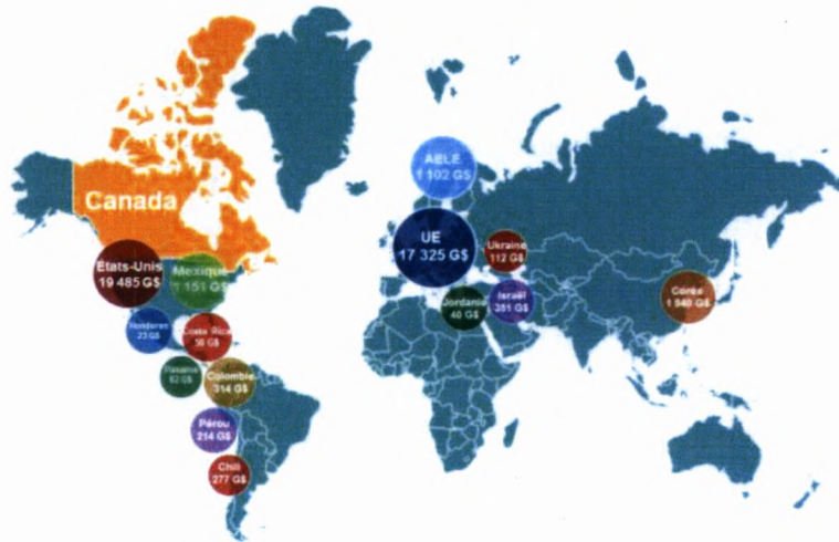
Pays et zones économiques qui ont des accords de libre-échange avec le Canada, 2017 Produit intérieur brut (PIB) (dollars américains)