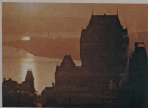
Cidade de Quebec, centro da vida cultural franco canadense

É por esta razão que o Canadá considera a "francofonia" como um efetivo meio de trocar pontos de vista sobre o diálogo Norte-Sul, relações Ocidente-Oriente, problemas de desenvolvimento e programação cultural. A Comunidade agora representa o grupo de países inteira ou parcialmente "francôfônicos", assim como o movimento que visa prover um marco organizado para os 150 milhões de pessoas de língua francesa com raízes culturais em comum.