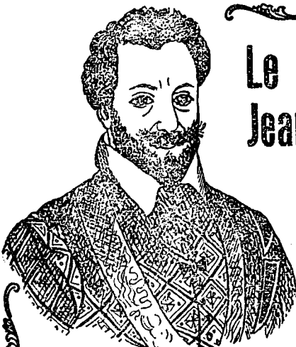
JEAN DE ST-MICHEL

C'est cet illustre personnage qui en 1661 créa la marque "VIN ST-MICHEL" dont l'étiquette actuelle est la fidèle reproduction.