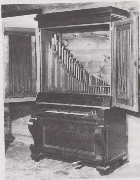
Orgue à tuyaux construit vers 1830.

complète si l'on ne pouvait entendre le son de cet instrument. La Bibliothèque nationale présente ainsi, en juillet et août, le vendredi midi, des récitals d'orgue et des concerts de musique de chambre mettant en vedette des pièces pour orgue. Lors de ces récitals et concerts, les musiciens disposeront d'un orgue à tuyaux portatif de la maison Casavant frères. Celui-ci est l'un des 3 instruments de qualité montés spécialement à la Bibliothèque nationale pour l'exposition, les 2 autres étant un orgue fabriqué vers 1830 par les ébénistes Blythe et Kennedy d'Ottawa, prêté par le Musée Bytown, et l'harmonium figurant dans le studio de musique,