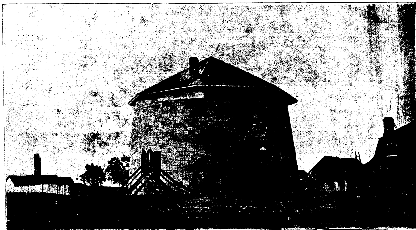
VUE DE L'UNE DES TOURS FAISANT PARTIE DES FORTIFICATIONS DE QUÉBEC