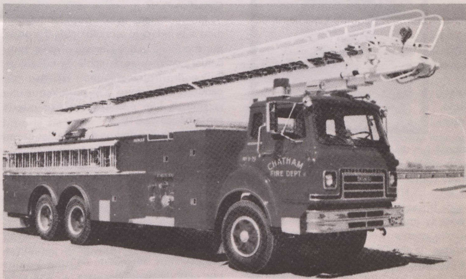
Equipo de lucha contra incendio.

Se puede obtener más información dirigiéndose a la División Comercial de la Embajada de Canadá.