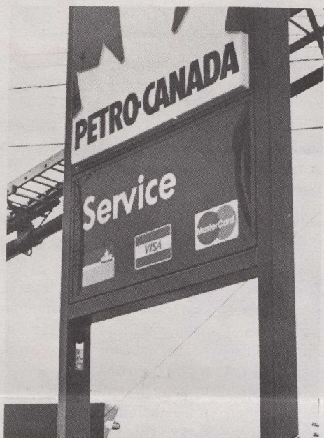
Entre los tres nuevos letreros erigidos en el este de Canadá se encuentra este de Halifax.

estatal prosigue su camino hacia este objetivo y ha contratado un equipo de personal experimentado en perforación costera canadiense de primera categoría.