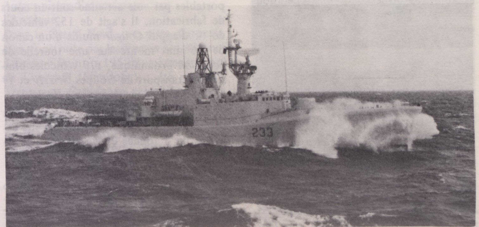
Le HMCS Fraser est l'un des six destroyers escorteurs de la classe St-Laurent qui seront remplacés par six nouvelles frégates de patrouille, quand débutera le programme de construction des navires en 1981.

Le 18 janvier 1967, la ville de Yellowknife devenait la capitale des Territoires du Nord-Ouest.